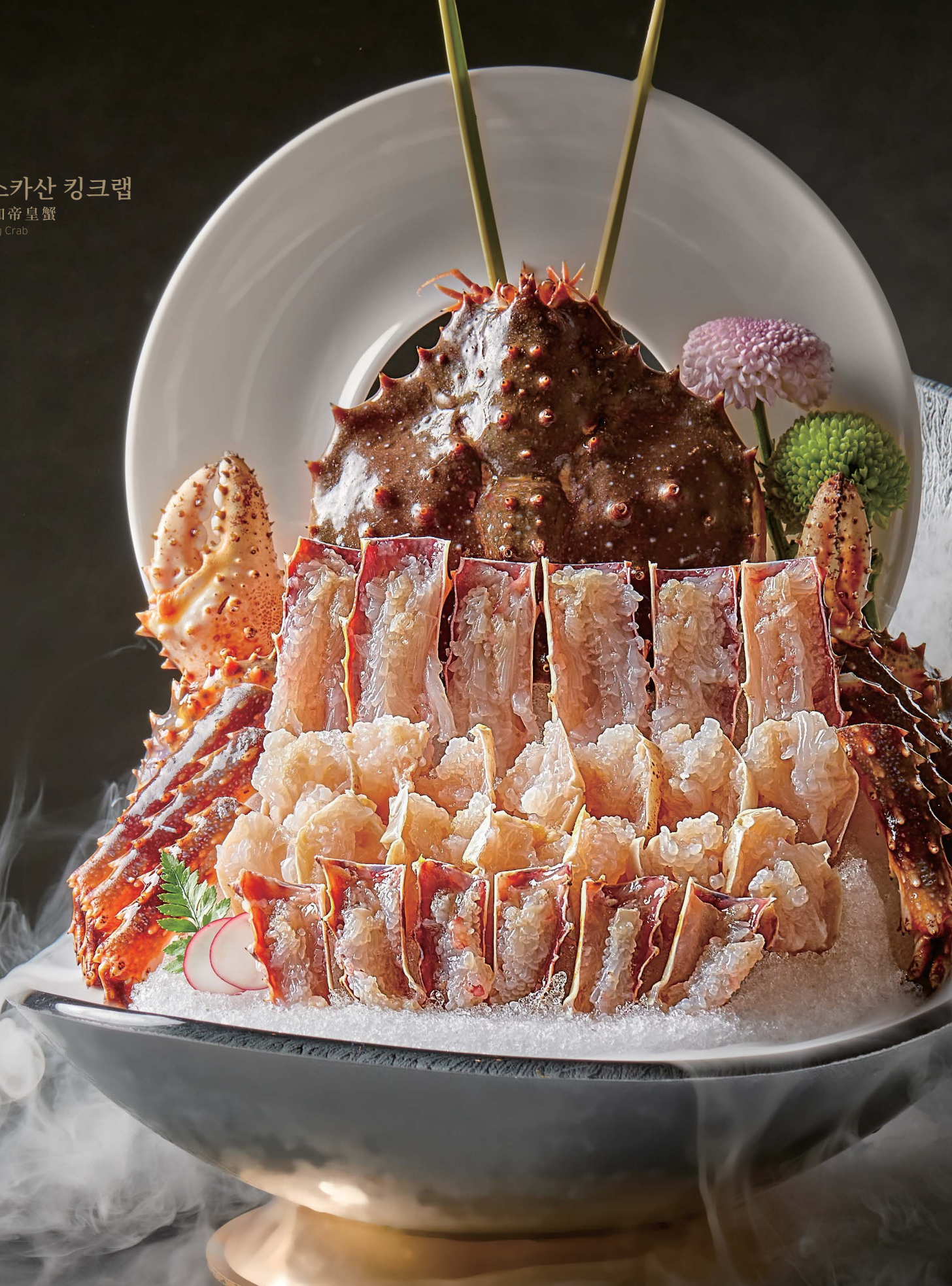
알래스카산 킹크랩 阿拉斯加帝皇蟹 Alaskan King Crab