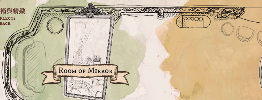
ROOM OF MIRROR

EVERY DETAIL REFLECTS ARTISTRY AND GRACE