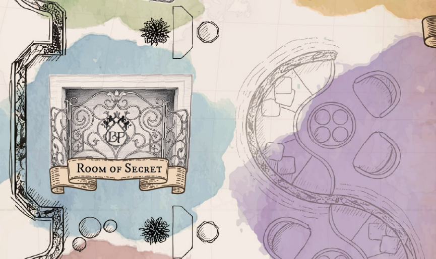
ROOM OF SECRET

EVERY CORNER HOLDS A WHISPER, AND EVERY SURFACE CONCEALS